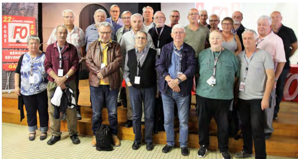
Les retraités présents au Congrès

Tout cela pour que vive le syndicalisme libre et indépendant : vive la fédération syndicaliste Force Ouvrière des Cheminots !