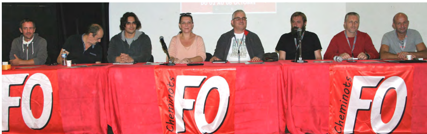
Le nouveau Secrétariat Fédéral